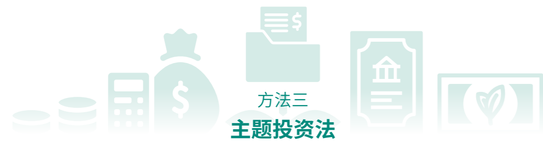
方法三 主题投资法