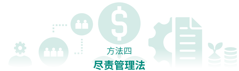
方法四 尽责管理法